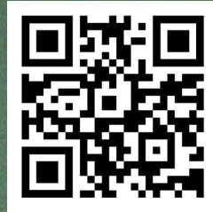
Khadka Qaylodhaanta Ecpat

Sahanka Ecpat ee 'Nude på nätet' (Qaawanaanta Internetka) 2023