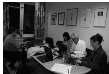
ECPAT-representanter från Danmark, Japan, Nya Zeeland och Schweiz på hotline-utbildning.