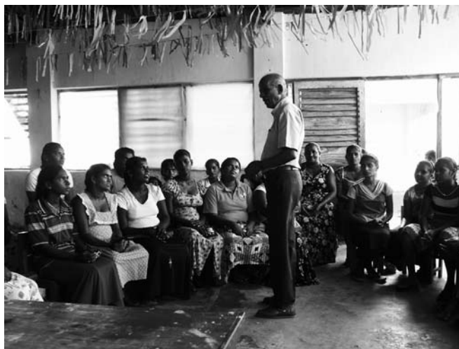
Ett av ECPAT-organisationen P.E.A.C.E program för mödrar drabbade av tsunamin.

P.E.A.C.E. planerar att fortsätta sitt stödarbete under hela 2006 bl a genom verksamhet med kurser och utbildning för barnen och yrkeskurser och utrustning för de vuxna. En viss utdelning av basvaror och basutrustning kommer också att fortsätta, eftersom en del familjer fått mycket liten hjälp från regeringen. Även om de fått ny bostad av myndigheterna står många helt utan ägodelar och utan möjlighet att försörja sig. Information om P.E.A.C.E. arbete finns också på deras hemsida www.lanka.net/charity/peace