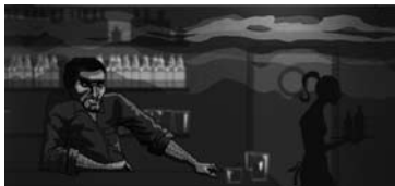
Bild ur online-spelet "Finding Sasja".

För målgruppen ungdomar i gymnasieåldern producerades ett spel på Internet om trafficking. Spelaren ska finna en flicka som försvunnit efter att ha rest till Sverige från ett land i öst. Genom olika val får spelaren kunskap om trafficking, vilken situation trafficking-offer befinner sig i och vilken roll köparna spelar. Spelet erbjuds på www.findingsasja.se och är helt kostnadsfritt. Tanken är att spelet ska fungera som underlag till diskussion i klassrummet. På spelsidan finns en lärarhandledning att ladda ner med fakta och förslag till diskussionsfrågor. Information om spelet har bl a gått ut via Skolportens nyhetsbrev som når 16 500 rektorer och skolledare på gymnasienivå och motsvarande på grundskolenivå. Annonseringen påbörjades 2005 hos företaget Kunskapskraft och media, som bl a sprider skolmaterial om värdegrundsfrågor, och avslutas först hösten 2006. Information har även gått ut via e-post till samtliga kommuner med uppmaning att sprida vidare till respektive skolor. Spelet har bl a förevisats på Bok och Biblioteksmässan i Göteborg och Skolmässan i Stockholm.