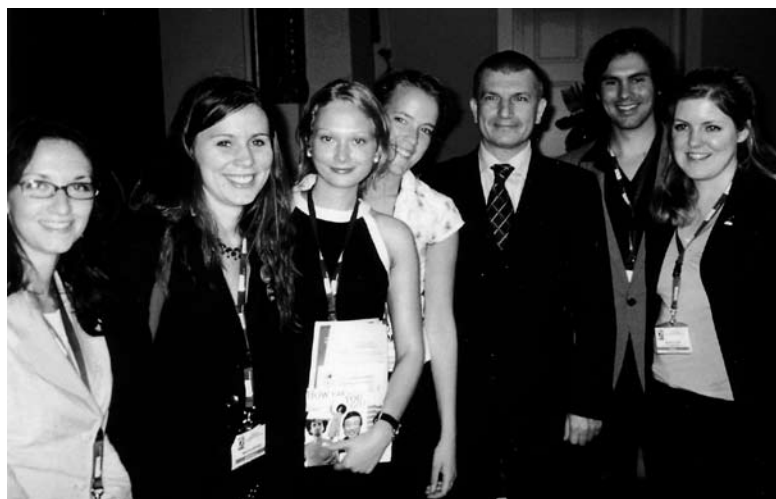
Ungdomsrepresentanter från mötet i Ljubljana. Från vänster: Italien, Norge, Ukraina, Sverige, Slovenien (inrikesministern), Nederländerna och Sverige igen.

finansiellt stöd, kunde två förberedande dagar hållas för sammanlagt tretton ungdomar från elva olika länder från Väst-, Central- och Östeuropa. Under dessa dagar fick ungdomarna utbildning i ECPAT-nätverkets historia och ungdomsverksamhet samt dela sina erfarenheter och visioner med varandra.